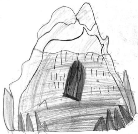
GROTTA DI SU BENATZU